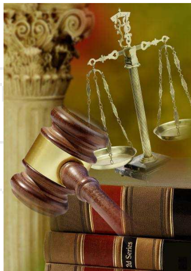
supplemento informatico alla rivista "TOSCANA MEDICA" Anno XI - n. 15 - 05/05/2011